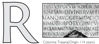
Columna Traiana (Origin 114 years)

ベースとなる書体「TRAJAN」は、ローマにあるトラヤヌス帝の円柱の台座 (紀元前1世紀) に刻まれた碑文を元に作られている。世界で最も古い書体をベースに用い、のちの世の中にも長く愛される企業となるよう願いを込めた。