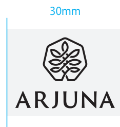
TYPE A: 縦組み [白銀比 1:1.414]

インターフェイスでの表示、印刷等再現の品質を保持するための最小使用サイズです。原則としてこれ以下のサイズでは使用しないでください。